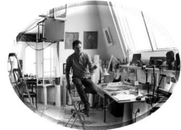
125 år gamle atelierer, 2018